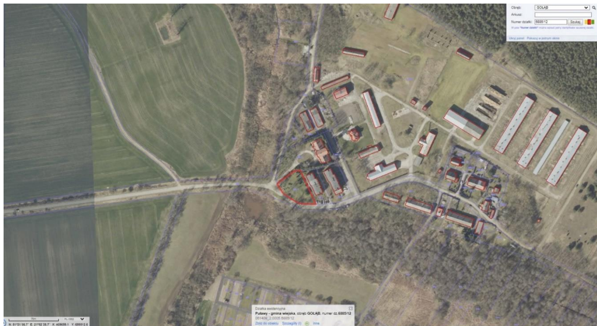
Rys. Usytuowanie działki nr 6885/12 w Borowinie

doświadczenie, potencjał techniczny oraz osoby o odpowiednich kwalifikacjach zawodowych.